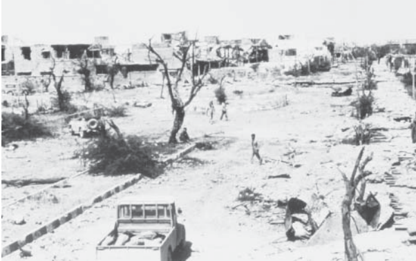
خرمشهر پس از آزادسازی؛ آثار تخریب شهر به دست اشغالگران عراقی

دو روز پس از آزادی خرمشهر، خبرنگار روزنامه کیهان از آغاز پاک‌سازی و بازسازی این شهر گزارش داد.