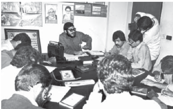
مصاحبه مطبوعاتی و رادیو تلویزیونی علی شمخانی جانشین فرمانده کل سپاه پاسداران

در همین حال، علی شمخانی جانشین فرمانده کل سپاه پاسداران، امروز در یک مصاحبه مطبوعاتی و رادیو و تلویزیونی درباره وظایف سپاه و فعالیت‌های آن گفت: «سپاه پاسداران سازمانی است که دارای مأموریت‌های متنوع و همه‌جانبه‌ای است. امروز مسئله جنگ، مسئله اساسی و محوری انقلاب است که قاعدتاً سپاه باید نیروهای اصلی و عمده‌اش را در این محور می‌گذاشت که تا به حال عمل کرده است، اما در حالی که سپاه مشغول نبرد با نیروهای مزدور امریکاست، از فعالیت‌های دیگرش غافل