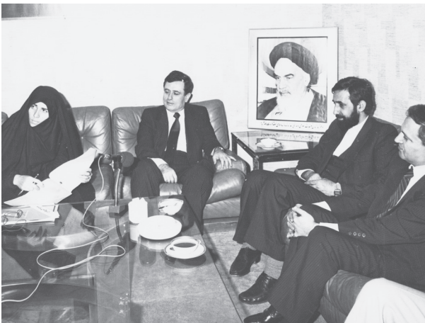
دیدار عبدالحلیم خدام با ولایتی وزیر امور خارجه

علی‌اکبر ولایتی وزیر امور خارجه نیز در مورد سفر هیئت سوری به ایران و مواضع آن کشور