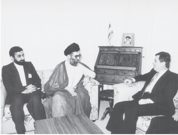
دیدار عبدالحلیم خدام با آیت‌الله خامنه‌ای رئیس‌جمهور

عبدالحلیم خدام در دیدار با مقامات ایران بر مواضع سوریه در حمایت از این کشور در جنگ تحمیلی تأکید کرد. وی در مورد نامه رئیس‌جمهور سوریه گفت: «پیامی از پرزیدنت حافظ اسد به رئیس‌جمهوری ایران تسلیم گردید که این پیام پیرامون اوضاع متشنج خلیج فارس بود. همچنین [آیت‌الله] خامنه‌ای نامه‌ای درباره همین مسئله توسط من برای حافظ اسد فرستادند.» معاون