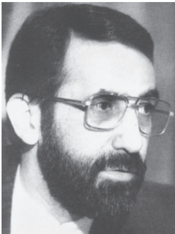
علی‌اکبر ولایتی وزیر امور خارجه جمهوری اسلامی ایران