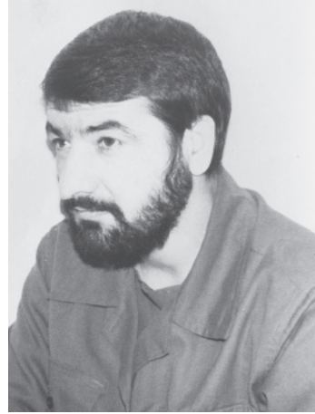
محسن رضایی فرمانده کل سپاه پاسداران انقلاب اسلامی