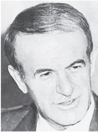
حافظ اسد رئیس‌جمهور سوریه

حافظ اسد رئیس‌جمهوری سوریه، در حالی که روابط کشورش با ایران را خوب توصیف کرد، تصرف شبه‌جزیره فاو به دست نیروهای ایرانی را موجب تضعیف موضع سوریه در جهان عرب دانست. یک نشریه سوری نیز حمله عراق به قطار مسافربری را نقض قوانین بین‌المللی و بخشی از توطئه امریکا و عراق برشمرد.