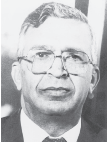
سعدون حمادی رئیس مجلس عراق

سعدون حمادی رئیس مجلس عراق، در پیامی برای رئیس اتحادیه بین‌المجالس، سیاست جنگی جدید عراق موسوم به استراتژی دفاع متحرک را پس از اشغال شهر مهران تشریح کرد. به گزارش رادیو مسقط، وی در این پیام گفته است که سیاست جنگی جدید عراق خاتمه دادن به جنگ، برقراری صلح، مبادله اسرا و زمین‌ها، عقب‌نشینی نیروهای دو طرف به مرزهای بین‌المللی، ایجاد راه‌حل جامع و عادلانه براساس حفظ حقوق دو کشور و دخالت نکردن در امور یکدیگر را تسریع خواهد کرد.