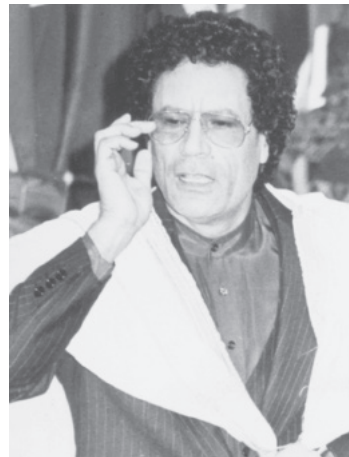
معمر قذافی رئیس‌جمهور لیبی

به گزارش نمایندگی جمهوری اسلامی ایران در طرابلس، قذافی رئیس‌جمهور لیبی، عصر امروز، در سخنانی در شهر بنغازی به تفصیل از حضور میلیونی ملت مقاوم ایران در راه‌پیمایی روز قدس سال گذشته و وجود روح انقلابی حاکم بر جمهوری اسلامی تجلیل کرد و نتیجه گرفت که مقاومت و حضور مردم در صحنه، قدرتی بیش از بمب‌ها، موشک‌ها و حمله هواپیماهای مهاجم عراق دارد. او گفت: «ملت ایران علی‌رغم تهدیداتی که عراق درخصوص بمباران به‌وسیله هواپیماهایش در روز قدس کرده بود و به‌اجرا نیز درآمد، اما با حضور یکپارچه چند میلیونی و با مشارکت زن و مرد و کودکان در تهران مقاومت نمودند و زیر بمب‌ها و موشک‌ها شعارهای خود را مبنی بر ضرورت آزادی قدس با صدای بلند سر دادند و نشان دادند که بمب و موشک اثری در روحیه انقلابی آنها نمی‌گذارد.» معمر قذافی که این مطالب را بیشتر به‌منظور تهییج ملت خود و رفع نگرانی آنها از هجوم هواپیماهای دشمن بیان می‌کرد، در ادامه افزود که مایل است ارتشی یک‌میلیونی از ملت لیبی به‌منظور مقابله با دشمن و دفاع از شهرها تشکیل شود. وی چندین بار پیشنهاد کرد یک‌میلیون نفر لیبیائی هریک با پرداخت هزینه یک مسلسل کلاشینکف در خرید و ساخت یک‌میلیون قبضه کلاشینکف مشارکت کنند. قذافی درمورد