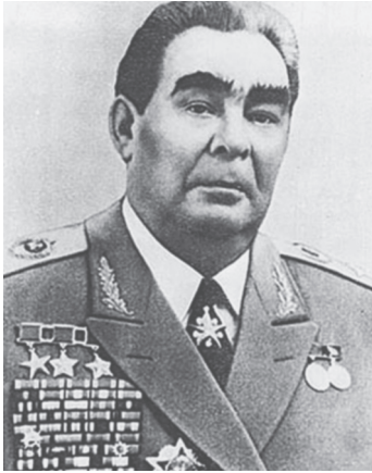
پیام‌های معنی‌دار لئونید برژنف رهبر شوروی به مقامات ایران و تفاوت چشمگیر جایگاه امام خمینی و بنی‌صدر از نظر وی

امور داخلی یکدیگر تکیه کرده و می‌کند. مردم شوروی نسبت به مبارزه عادلانه مردم دلیر ایران علیه دسیسه‌های امپریالیسم و استعمار به‌خاطر حق مالکیت بر ثروت‌های طبیعی خود و تأمین حق مالکیت، استقلال و تمامیت ارضی میهن خود احترام فراوان و حسن‌نظر قائل است. اظهار اطمینان می‌نمایم که روابط اتحاد شوروی و ایران در آینده نیز در راه دوستی، حسن هم‌جواری و همکاری متقابلاً مفید پیش خواهد رفت. لئونید برژنف، مسکو، کرملین، ۱۹ ماه مه سال ۱۹۸۰» ۱۰