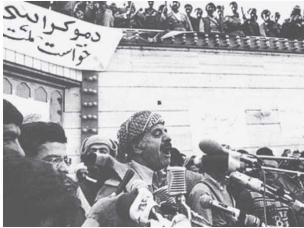
عبدالرحمن قاسملو در میتینگ حزب دمکرات مدعی شد: باینکه دولت راه مذاکره را بسته است، ما همیشه برای مذاکره حاضریم.

امروز همچنین در ساعت ۱۸:۰۰، حزب دمکرات اجتماع بزرگی در مهاباد برگزار کرد. گزارش شهربانی مهاباد از این قرار است: «از طرف حزب دمکرات میتینگی در میدان شهیدان مهاباد برگزار گردید. در این میتینگ که عده کثیری از اهالی شهر و سایر مناطق کردستان شرکت داشتند دکتر