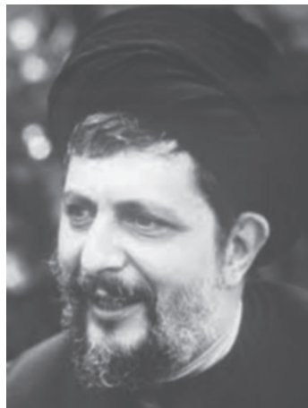
کمیسیون تحقیق سرنوشت امام موسی صدر اعلام کرد: ادعای لیبیایی‌ها در مورد ورود وی به ایتالیا واقعیت ندارد.

طرابلس عازم رم شدند، لیکن شاید به علت شتاب‌زدگی در این کار اشتباهات زیادی مرتکب شدند. این ۲ نفر ائاثیه امام گم‌شده را به هتلی در فرودگاه رم بردند، اتاق گرفتند و دیگر هرگز به چشم نخوردند، کمیسیون تحقیق دریافته است که اشیایی از چمدان‌ها گم‌شده و در نوشتن برچسب روی ائاثیه، خط امام را جعل کرده‌اند. ... نتایج تکان‌دهنده‌ای که این کمیسیون ایرانی بدان دست یافته است در ضمیمه‌ای محرمانه مندرج می‌باشد. این ضمیمه نشان می‌دهد که امام موسی صدر و همراهانش در تاریخ ۳۱ اوت، توسط مأموران امنیتی لیبی ربوده شده و به یکی از اردوگاه‌های نظامی این کشور در ۴۰ کیلومتری جنوب طرابلس انتقال داده شده و وی را در یک دادگاه نظامی